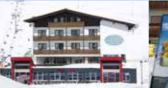
Pizzeria Da Bruno