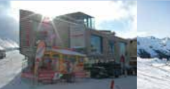
Follow me Cafe Inside