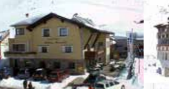
Gasthof Schöne Aussicht