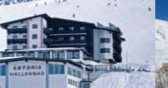
Hotel Astoria + Eisbar