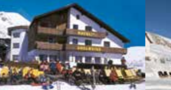
Hotel Edelweiss + Eisbar + Schirmbar