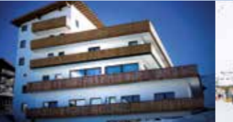
Hotel Tyrol + Fiasco + Eiseis