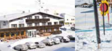
Gasthof Sonne & Schnee