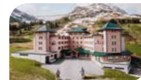
Hotel Alpenrose, Tel. +43 5239 / 5205