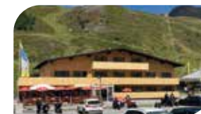
Sonne & Schnee, Tel. +43 5239 / 21 600