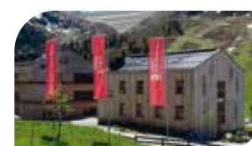
Restaurant Castello, Tel. +43 5239 / 520 181