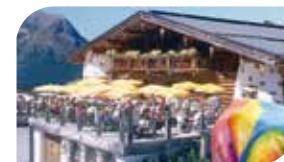
Kühtai Dorfstadl, Tel. +43 5239 / 5265