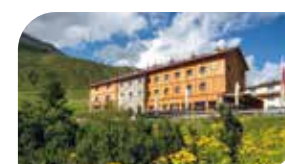
Dortmunder Hütte, Tel. +43 5239 / 52 02