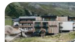
VAYA Kühtai, Tel. +43 50 125 627