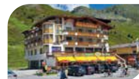
Kühtai Shop, Tel. +43 5239 / 52 70