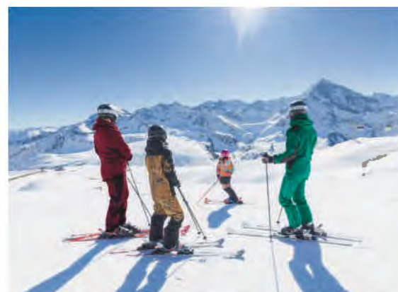
Lifting im Kühtai