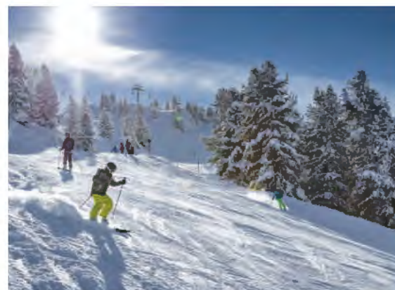
Pistengaudi in Hochoetz